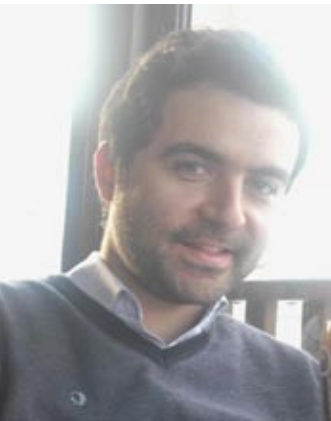
*Γράφει ο Αντώνης Θεοχαρόπουλος

Το Περ. Παράρτημα Κεντρικής Μακεδονίας του Γεωτεχνικού Επιμελητηρίου Ελλάδας (ΓΕΩΤ.Ε.Ε.) και ο Σύλλογος Γεωπόνων Νομού Ημαθίας με την υποστήριξη του Δήμου Βέροιας συνδιοργάνωσαν Εσπερίδα με θέμα: «Νέες Εναλλακτικές Καλλιέργειες: Προοπτικές – Νέες Προτάσεις για την Αγροτική Οικονομία» την Τετάρτη 15 Μαΐου 2013 και ώρα 18.30