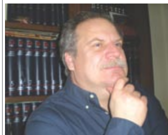
Γράφει ο Αλέκος Χατζηκόστας*

Η τρίκομματική κυβέρνηση σκοπεύει μέσα από τις καταργήσεις και συγχωνεύσεις των Νομικών Προσώπων και τη μετατροπή των ΝΠΔΔ σε ΝΠΙΔ να γεμίσει τις δεξαμενές των απολυμένων και να πιάσει τους συμφωνημένους με την Ευρωπαϊκή Ένωση και το ΔΝΤ στόχους. Γι αυτό προωθεί άμεσα το Σχέδιο Νόμου για την