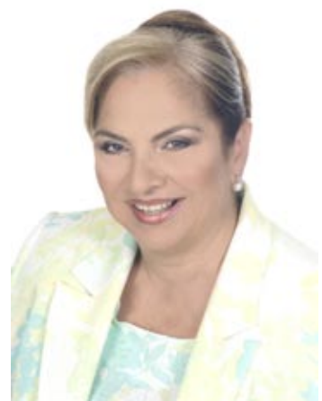
Άρθρο της Χαρίκλειας Ουσουλτζόγλου - Γεωργιάδη*