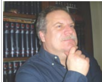
Γράφει ο Αλέκος Χατζηκόστας*

Αφορμή για τις παρακάτω σκέψεις έδωσε αφενός το πρόσφατο συνέδριο της ΚΕΔΕ (σελ. 6) και αφετέρου το γεγονός ότι ο χρόνος για τις επόμενες εκλογές άρχισε να μετρά αντίστροφα και ήδη έχουν εμφανιστεί και οι πρώτοι ενδιαφερόμενοι γι'αυτές. Επομένως σήμερα καταθέτουμε ορισμένες γενικότερες σκέψεις μας,