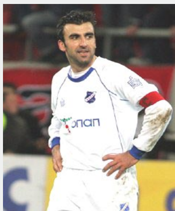
Γράφει ο Γιώργος Κουλακιώτης

Τα πρωταθλήματα όλα έχουν τελειώσει στην Ευρώπη και το πιο σημαντικό και σοβαρό τουρνουά του καλοκαιριού είναι το confederation cup ( κύπελλο συνομοσπονδιών ) που θα γίνει στην Βραζιλία από 15 ως 30 Ιουνίου και λειτουργεί ως πρόβα τζενεράλε για το παγκόσμιο κύπελλο 2014 που θα γίνει στην Βραζιλία. Στο τουρνουά αυτό συμμετέχουν η διοργανώτρια Βραζιλία, η παγκόσμια πρωταθλήτρια Ισπανία, όπως και οι πρωταθλήτριες χώρες της κάθε ηπείρου. Επειδή η Ισπανία είναι πρωταθλήτρια κόσμου και Ευρώπης την μια θέση θα πάρει η φιναλίστ του euro Ιταλία. Οι υπόλοιπες χώρες που συμμετέχουν είναι η Ουρουγουάη, Μεξικό, Ιαπωνία, Νιγηρία και Ταϊτή.