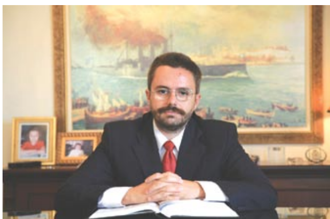
Γράφει ο Ιωάννης Παπαγιάννης*

Ο τουρισμός συνιστά οικονομικό και διαχρονικό φαινόμενο που προάγει και προάγεται από τον πολιτισμό και την κοινωνική ελευθερία. Είναι συνώνυμος της κατανάλωσης και του ελεύθερου χρόνου. Η σπουδαιότητα του τουρισμού για την μελλοντική οικονομική ανάπτυξη και τον περιορισμό της ανεργίας είναι πλέον διαπιστωμένη και αναμφισβήτητη. Τα τουριστικά προϊόντα θα πρέπει να ανταποκρίθουν στις καινούργιες απαιτήσεις της ζήτησης, δίνοντας έμφαση στην εξατομίκευση και την εξειδίκευση και όχι στην μαζική προσφορά και την τυποποίηση.