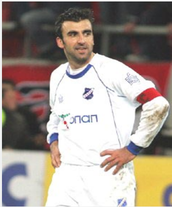
Γράφει ο Γιώργος Κουλακιώτης