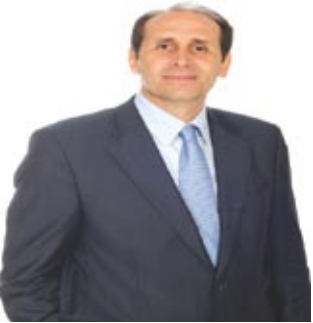
Άρθρο του Απόστολου Βεσυρόπουλου*

Η πάταξη της φοροδιαφυγής στην Ελλάδα, μέχρι σήμερα, παρέμενε στο πεδίο των ευχολογίων και των εξαγγελιών. Σκόνταφτε πάντα στο έλλειμμα αποφασιστικότητας που οδηγούσε με τη σειρά του, στη διόγκωση των δημοσιονομικών ελλειμμάτων.