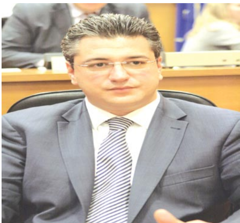
*Συνέντευξη στο Καλλίστρατο Γρηγοριάδη

Κύριε Τζιτζικώστα, εκλεγήκατε Περιφερειάρχη Κεντρικής Μακεδονίας σε μια ιδιαίτερα κρίσιμη περίοδο για τον τόπο μας και την αυτοδιοίκηση. Ποια είναι τα σημαντικότερα ζητήματα, στα οποία δίνετε προτεραιότητα;