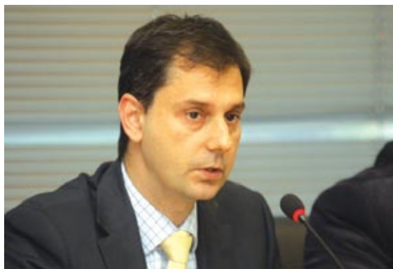
Χάρης Θεοχάρης - Γενικός Γραμματέας του Υπ. Οικονομικών

«Δήμευση» και του εφάπαξ των συνταξιούχων που αδυνατούν να πληρώσουν τα χρέη τους προς το Δημόσιο ετοιμάζει το υπουργείο Οικονομικών διά του γενικού γραμματέα του Χάρη Θεοχάρη. Εντός των ημερών θα στείλει επιστολές στις διοικήσεις των ασφαλιστικών ταμείων, με τις οποίες θα τους ζητά να παρακρατούν το ποσό των οφειλών από το εφάπαξ των συνταξιούχων του Δημοσίου, των τραπεζών κ.λπ. Επίσης, θα ζητήσουν άμεσα από την Ενία Αρχή Πληρωμών να παρακρατεί μισθούς δημοσίων υπαλλήλων έναντι χρεών, ενώ ετοιμάζουν «πεσκέσια» προς ιδιωτικές επιχειρήσεις,