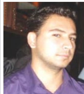
Γράφει ο Σωκράτης Αναστασίου*