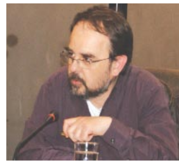
Γράφει ο Ηλίας Τσιαμήτρος

Συμπερασματικά, η ανανέωση του πολιτικού προσωπικού, δεν φαίνεται να είναι μονάχα θέμα ηλικίας. Εκείνο που είναι απόλυτα επιθυμητό για έναν νέο πολιτικό του ΑΥΡΙΟ για την χώρα μας, δεν είναι μονάχα η ημερολογιακή νεότητα. Έχουμε ανάγκη από νέους πολιτικούς αυτό είναι αλήθεια. Έχουμε ανάγκη από πολιτικούς τίμιους, ικανούς, με κοινωνικές δεξιότητες, με ιδέες, με όραμα αλλά και δύναμη, κρίση και την ανάλογη εμπειρία να τις υλοποιήσουν. Πιστεύω πως αυτοί οι πολιτικοί δεν είναι δυνατόν να είναι «αμούστακα παιδαρέλια» των τριάντα ετών στην πλειοψηφία τους. Θα μπορούσαν να υπάρχουν στις τάξεις τους όμως και τέτοιοι, αν είχαν αναδειχθεί μέσα από την ίδια την κοινωνία με ανοιχτές διαδικασίες αξιολόγησης και επιλογής. Η κύρια πηγή ανανέωσης του πολιτικού προσωπικού, εξακολουθώ όμως να πιστεύω πως θα πρέπει να είναι η δεξαμενή των εμπειριών, ικανών και επιτυχημένων επαγγελματιών ανθρώπων που αυτή την στιγμή στην πλειοψηφία τους απέχουν συνειδητά από τα πολιτικά δρώμενα. Ο τρόπος να προσελκύσει η Πολιτική τέτοιους «ερωμένους» στην εκκλησιά της είναι γνωστός και πολύ-συζητημένος. Θα πρέπει να αλλάξει «σκοπός» και «τρόπος» η ίδια. Αυτό δεν είναι εύκολο και μάστιχα «εν λειτουργία». Είναι αδύνατον όμως να γίνει «εν στάση» για ευνόητους λόγους. Οι σημερινοί πολιτικοί αρχηγοί λοιπόν, φέρουν εκτός των άλλων και την ευθύνη της ανανέωσης του πολιτικού προσωπικού της χώρας. Αρχής γενομένης από τους ίδιους σε ορισμένες περιπτώσεις!