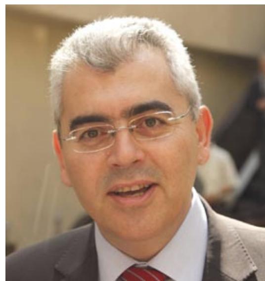
Αναπληρωτής Υπουργός Αγροτικής Ανάπτυξης και Τροφίμων κ. Μάξιμος Χαρακόπουλος

Σύμφωνα με ανακοίνωση του ΥΠΑΑΤ, υπό την προεδρία του Αναπληρωτή Υπουργού Αγροτικής Ανάπτυξης και Τροφίμων κ. Μάξιμου Χαρακόπουλου πραγματοποιήθηκε διευρυμένη σύσκεψη με θέμα την εύρυθμη λειτουργία της αγοράς αμνοερίφων ενόψει του Πάσχα.