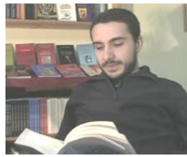
*Γράφει ο Κωνσταντής Σεβρής

Δε χρειάζεται ιδιαίτερο κόπο για να το αντιληφθείς. Η συμμετοχή σου σε μια «αυθόρμητη» κινητοποίηση ή μια επίσκεψη στα χώρους διαδικτυακών συζητήσεων είναι αρκετή για να σε πείσει. Οί Έλληνες υποτροπιάσαν. Τα τρωτά της εθνικής κατάθλιψης επέστρεψαν.