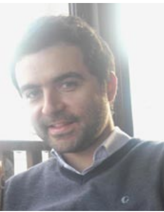
*Γράφει ο Αντώνης Θεοχαρόπουλος

Στο πλαίσιο της «πολλαπλής συμμόρφωσης», συνδέεται για πρώτη φορά η καταβολή των επιδοτήσεων με την «τήρηση των διαδικασιών έγκρισης για τη χρήση των υδάτων για άρδευση». Με άλλα λόγια, αυτό σημαίνει πως όσοι έχουν γεωτρήσεις χωρίς άδεια άρχισαν να αντιμετωπίζουν προβλήματα με την καταβολή της ενιαίας ενίσχυσης από το 2010 και είναι πολύ πιθανόν να βρεθούν αντιμέτωποι με την επιβολή προστίμων, που μπορεί να τους στερήσει και ολόκληρη την επιδότηση.