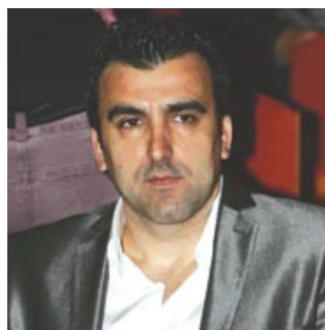
Γράφει ο Γιώργος Κουλακιώτης

Το πρωτάθλημα της super league τελείωσε και θα προσπαθήσουμε να αναλύσουμε τα παιχνίδια του κυπέλλου Ελλάδος και κάποια μεγάλα παιχνίδια του Σαββατοκύριακου 27 & 28/4/2013